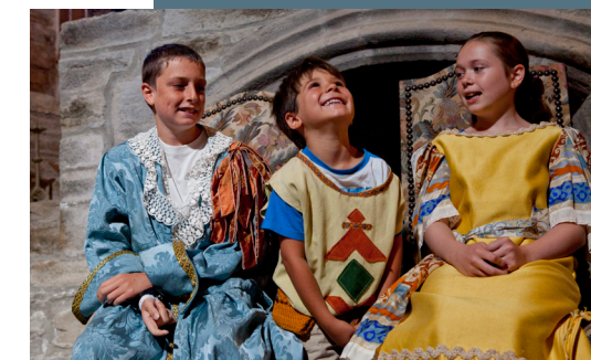
S'amuser au château