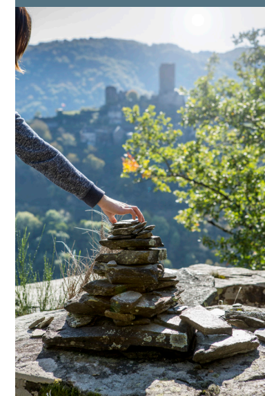
Les cairns de Valon